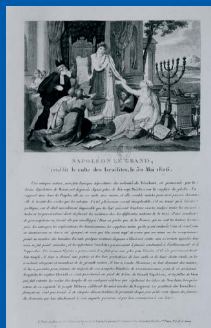
Napoléon rétablit le culte des israélites (1808). Paris, Centre historique des Archives nationales